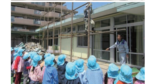
上／丸太の選定(※) 下／足場実演 大人の本気を見せる(※※)