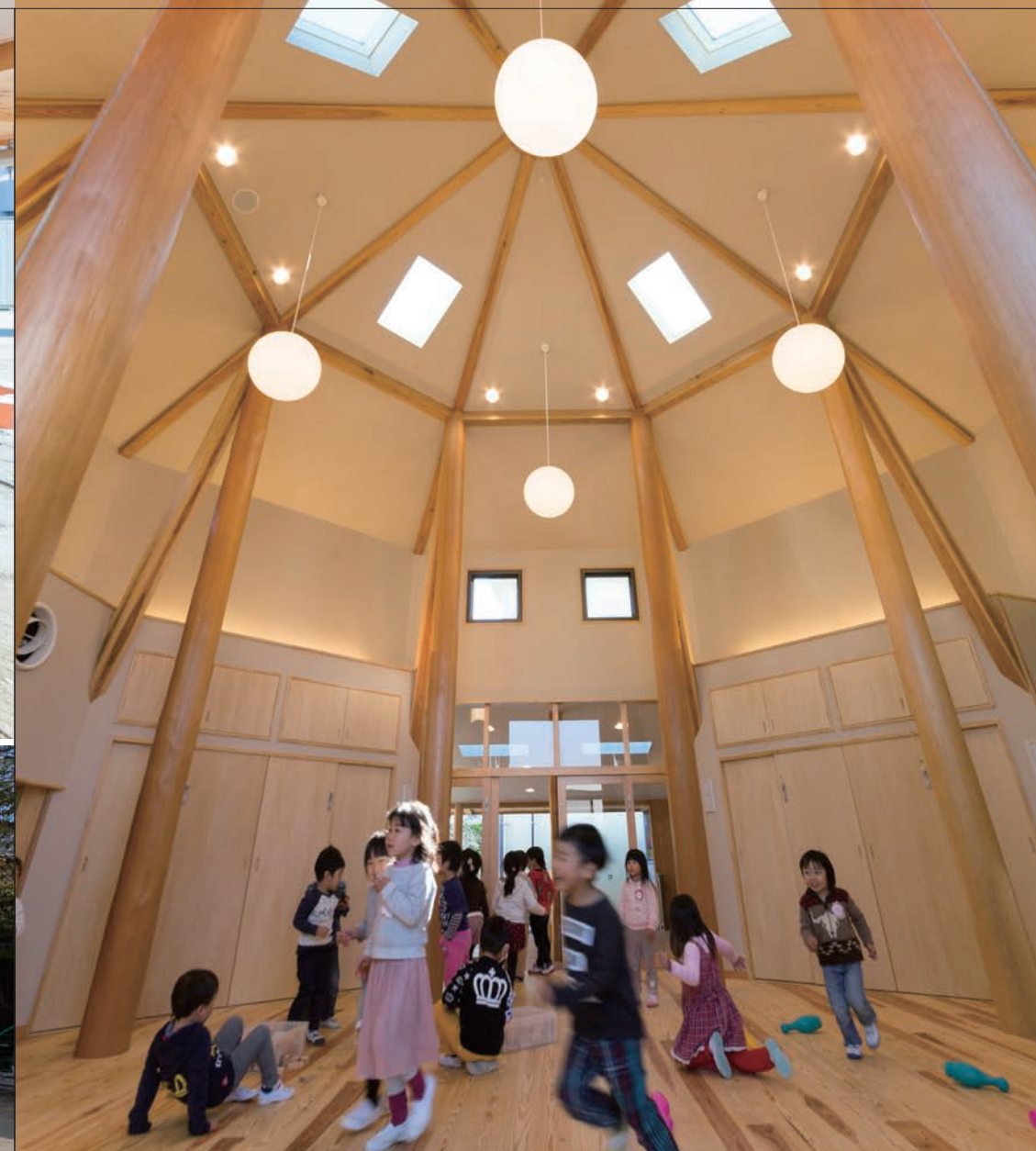
北山杉6mの丸太がそびえる「いりのりのおへや」 トップライトから天上の光が降り注ぐ。吸音材を使わず、他の保育室と音環境を変えた