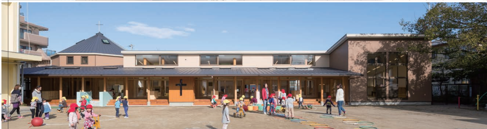
上／「ひろびろうか」 天窗のある低い勾配天井とし、開放性と落ち着きの両立を目指した 下／南側全景 先々代の園舎で使われていたものを磨いて掲げた十字架と大楯が、めぐみ70年の歴史を伝える