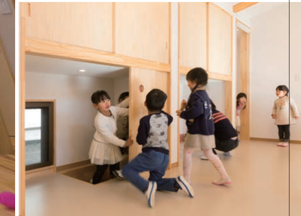
上／保育室 光と陰を肌で感じて 中／「えほんのあなぐら」 大人が協役になれる子どもスケール 下／収納下のかくれがコーナー 狭い居場所を用意する。地窓を設け子どもの背丈に風を通す